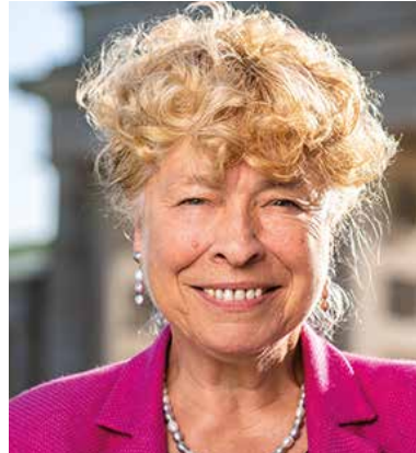
Prof. in Dr. in Gesine Schwan, Schirmherrin der Stiftung Bildung

Danke, dass Sie sich gemeinsam mit uns engagieren!